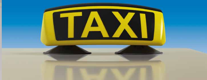
TRS-021 mit Einarmträger