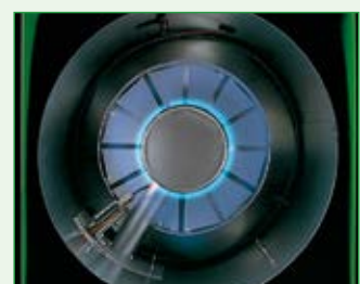
Effektive Verbrennung durch die Multi-Point-Injection