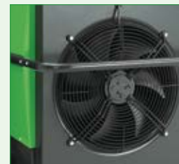
Leistungsstarke, geräuschoptimierte Sichel-Ventilatoren