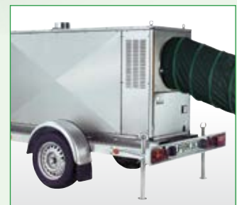
Die Heizzentrale mit Anhänger zugelassen für Straßenbetrieb