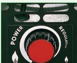
Eingebaute Power-Regulation für stufenlose Leistungsregelung