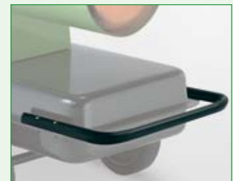
Transportbügel, vorne EDV-Nr. 1011228