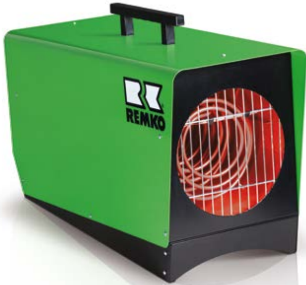
REMKO ELT 10-6