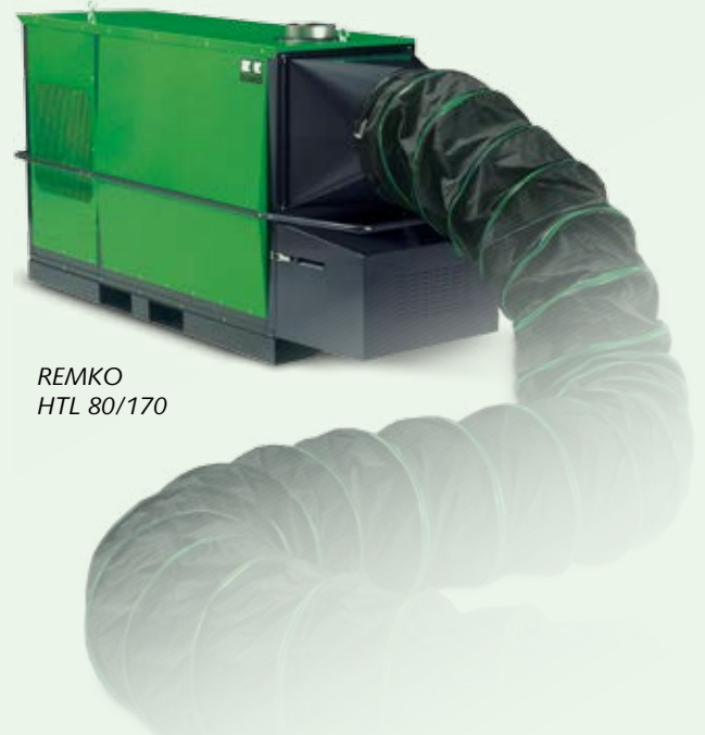
REMKO HTL 80/170