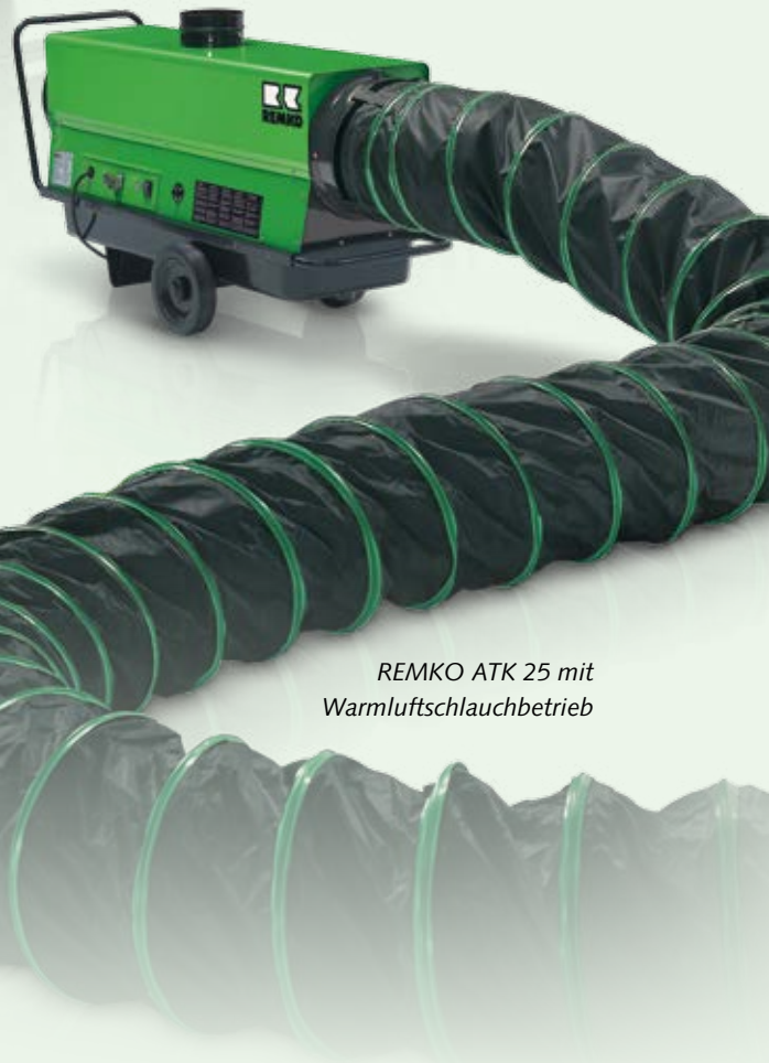
REMKO ATK 25 mit Warmluftschlauchbetrieb