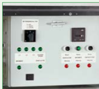
Schaltkasten mit Betriebsstundenzähler, geschützt eingebaut