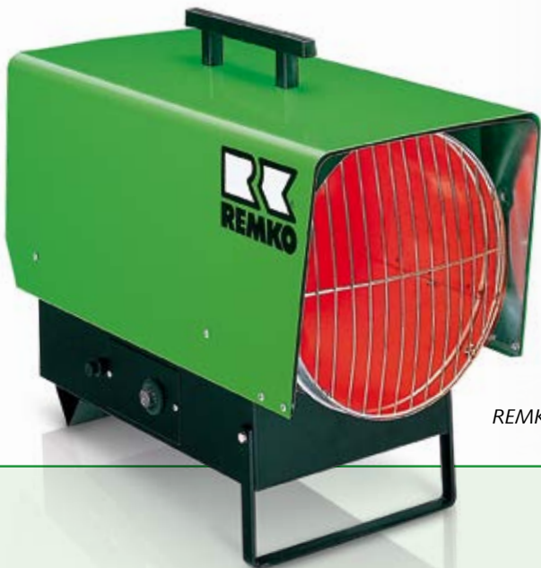
REMKO PGT 60