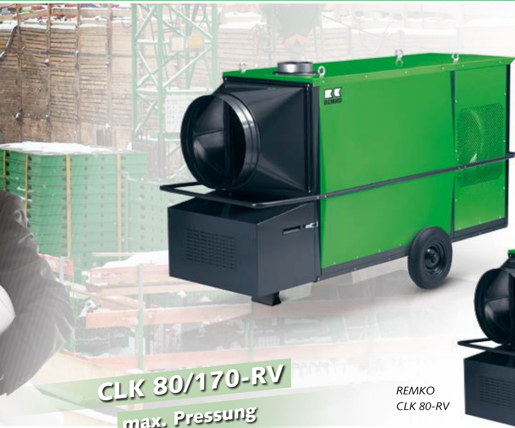
REMKO CLK 170-RV