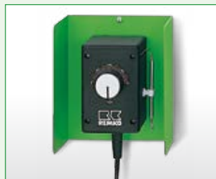
Feuchtraumthermostat EDV-Nr. 1011250

Optional erhältlich für die Geräte DZH 30-2 und DZH 50-2. Der einfach zu installierende Transportbügel schützt das Gerät vor unbeabsichtigten Stößen und eignet sich hervorragend als Transporthilfe.