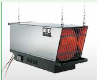
REMKO PGT 100 Ausführung INOX (Montagebeispiel)