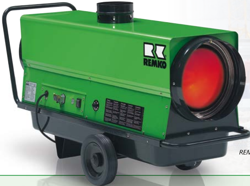
REMKO ATK 25