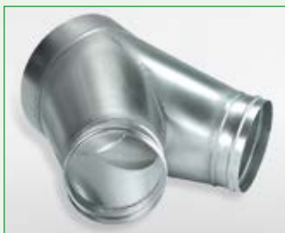
Multifunktions-Luftverteiler- kopf EDV-Nr. 1009560