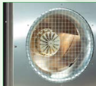
Spezial Radialventilatoren bei HTL 200 und 250