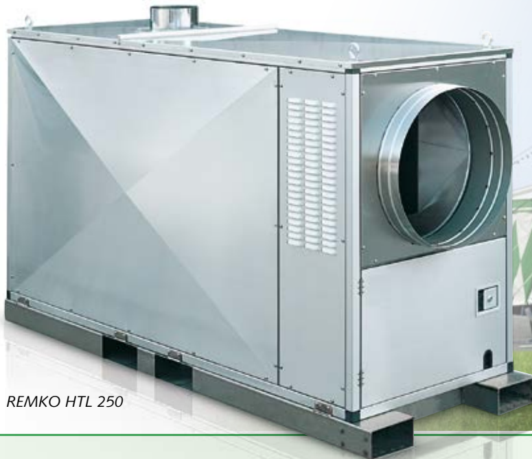
REMKO HTL 250

Serie HTL serienmäßig in Edelstahl-Ausführung, unübertroffen in Qualität und Leistung