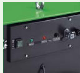
Schalt- und Bedienungs- tableau bedienerfreundlich und geschützt angeordnet