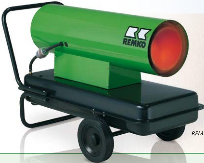
REMKO DZH 30-2