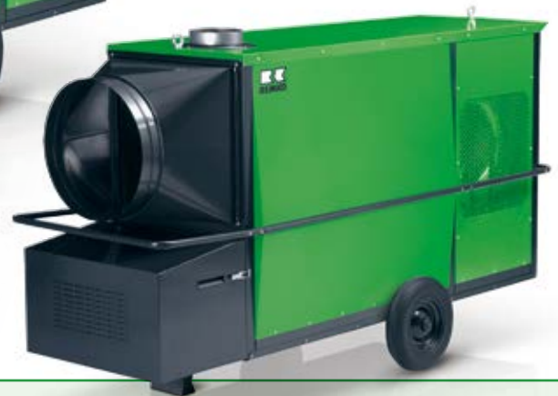
REMKO CLK 80-RV