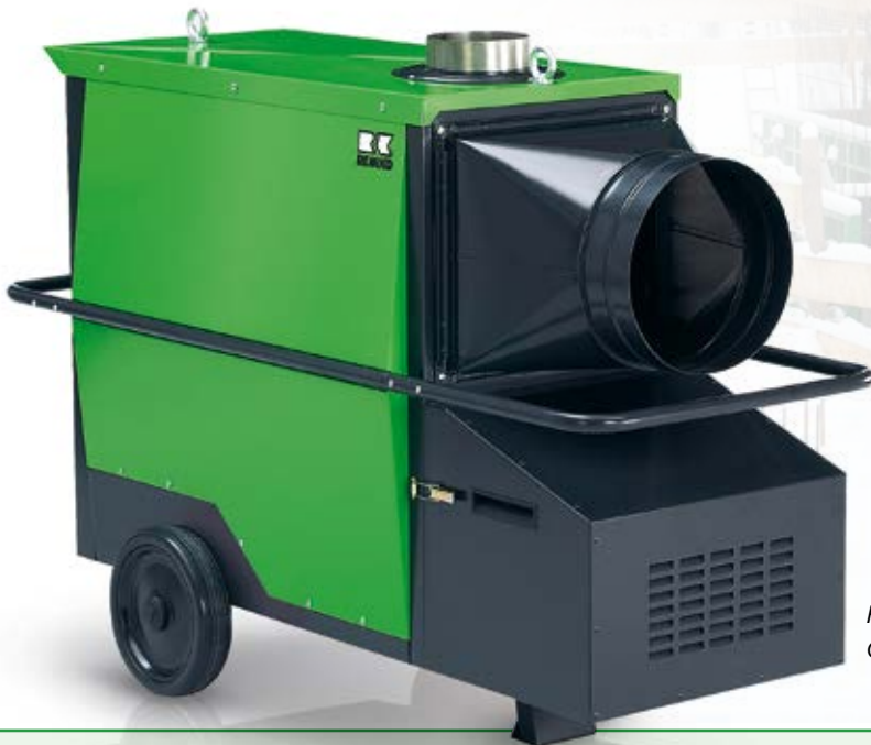
REMKO CLK 50