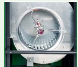
CLK 80-RV und 170-RV serienmäßig mit Radial- Ventilator