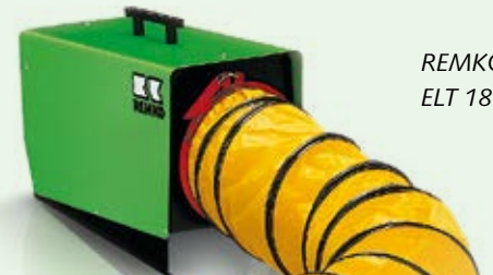
REMKO ELT 18-S