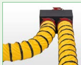
Betrieb mit Vorsatzstück und Warmluftschläuchen ELT 18-S