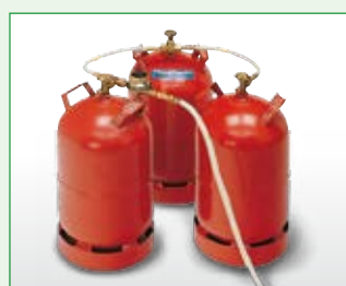
Mehrflaschen-Set EDV-Nr. 1014050