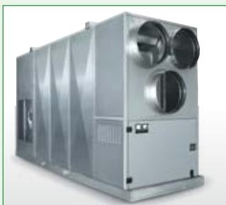
REMKO HTL 400