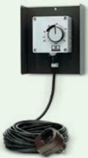
REMKO Raumhygrostat, Typ HR-1, zur vollauto- matischen Steuerung, steckerfertig