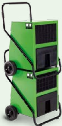
REMKO Luftentfeuchter sind stapelbar