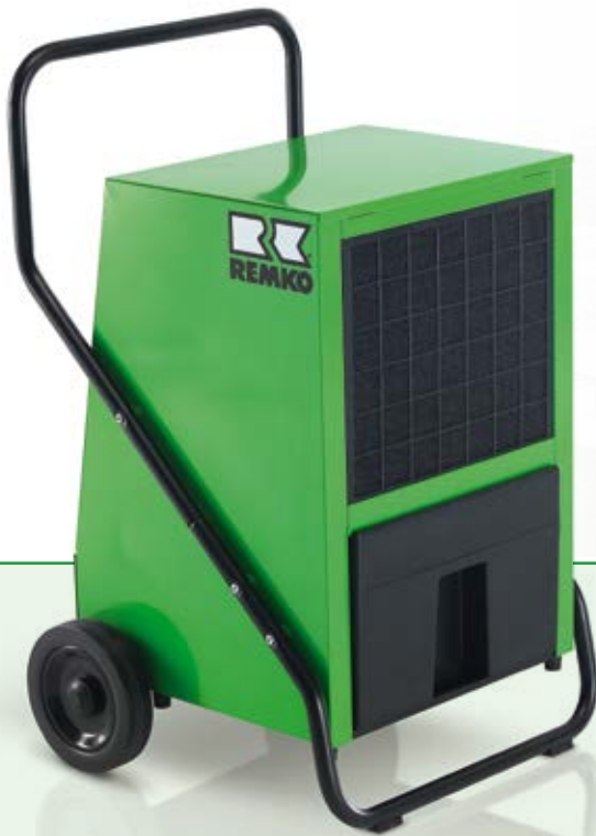
REMKO AMT 85-E

Trocknen und Entfeuchten zuverlässiger als Sonne und Wind